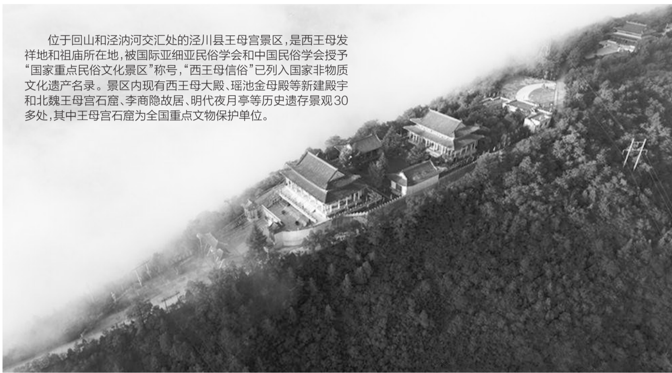
回山上的王母宫建筑群。

位于回山和泾河交汇处泾川县王母宫景区，是西王母发祥地和祖庙所在地，被国际亚细亚民俗学会和中国民俗学会授予“国家重点民俗文化景区”称号，“西王母信俗”已列入国家非物质文化遗产名录。景区内现有西王母大殿、瑶池金母殿等新建殿宇和北魏王母宫石窟、李商隐故居、明代夜月亭等历史遗存景观30多处，其中王母宫石窟为全国重点文物保护单位。