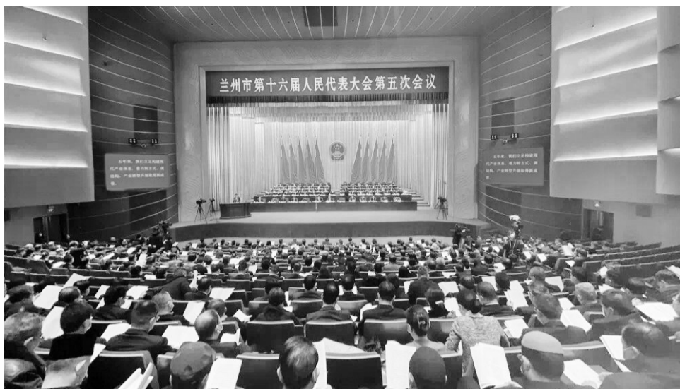
1月12日上午,兰州市第十六届人民代表大会第五次会议开幕。

对于“十四五”时期和2035年主要目标任务,张伟文指出,“十四五”时期兰州市经济社会发展的总体要求是:高举中国